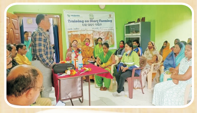
Training Program on Dairy Farming