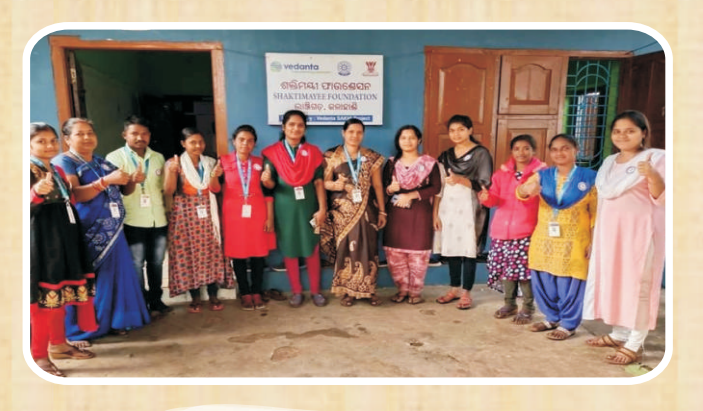
Entrepreneurship training program organized at Shaktimayee Foundation