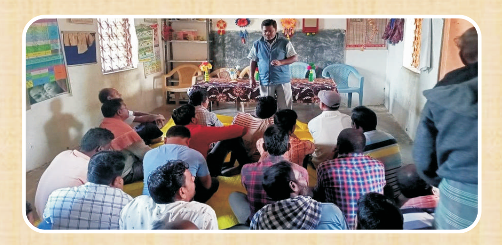
Farmer Mobilisation Activities at Jharbandh Block of Bargarh Dist