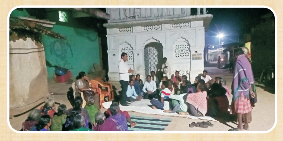
Farmer Mobilisation Activities in Bargarh Dist under central sector scheme for promotion of 10,000 FPOs

In order to double income of farmers by year 2022, Govt. of India (GoI) launched a Central Sector Scheme called Cluster Based Business Organizations (CBBO) for promotion of 10,000 Farmer Producer Organizations (FPOs). In Odisha this scheme is being promoted and administered by NABARD. Under this scheme MSF is acting as an implementing partner of NABARD. MSF has taken the responsibility to form and facilitate 7 FPOs in the districts of Kalahandi, Balangir and Bargarh. From baseline surveys to selection of Board of Directors (BoDs), KYC collections, making individual DSCs, product finalizations etc works have been completed to complete the registration process of all 7 FPOs in their respective districts. All FPOs are functioning with respective BoDs and shareholders.