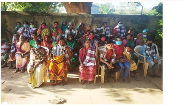
ଦୀପାବଳୀକୁ ଦାନଦୀପାବଳି ଭାବେ ସାତଦିନ ଧରି ପାଳିତ.....